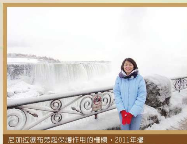
尼加拉瀑布旁起保護作用的柵欄，2011年攝

象徵是沙遊治療的語言。瞭解象徵並感受其在個案心靈旅程中的意義與變化，是陪伴個案療癒與前行最重要的關鍵之一。在這90分鐘的講座中，前段將以柵欄為例，帶領大家學習如何探索象徵，後段將分享在受限的會談時數下，沙遊治療如何陪伴與協助個案走向生命，並感受柵欄象徵在其傷痛中所起的轉化與療癒。