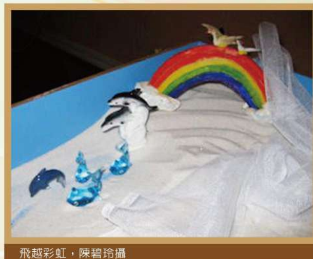
飛越彩虹

彩虹是雨後天空中出現的美麗奇觀，其稍縱即逝的特性以及絢爛的身影，不只令觀者讚嘆，更是引起無數騷人墨客或以詩歌，或以畫作等不同方式去歌頌它。本講座除了從科學觀點來陳述彩虹形成的原因，更從東西方的神話、宗教、藝術和電影等不同角度來探討彩虹背後所隱藏的意涵。最後再以一名歷經八八風災的原住民青少年的沙盤為例，描述歷經半年的短期沙遊治療，能幫助案主修復因風災引發的恐懼和不安，並在結案回鄉時能帶著內在的穩定與安全感，踏上漫長的重建之路。