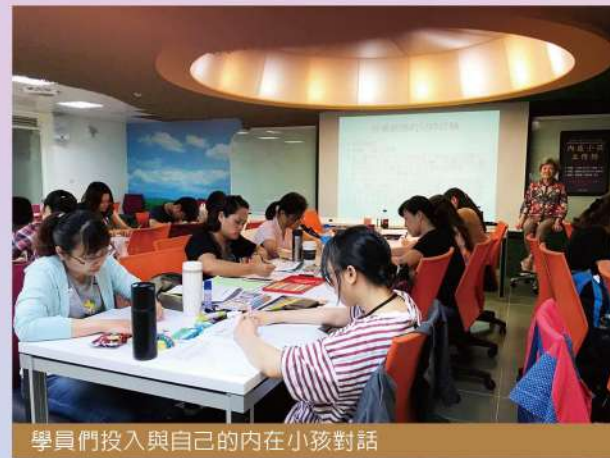
學員們投入與自己的內在小孩對話

由梁信惠博士主講，黃宗堅理事長主持的中區內在小孩治療訓練工作坊在彰化師範大學的創思坊展開，暑假的一開始便迎來了專業助人工作者最為重要並且基礎的深度自我探索和照顧。梁老師從受傷的內在小孩作為開始，逐步地引導學員發覺自己內在小孩的多重面向，最後重新肯定內在小孩的神奇與特別。學員們熱烈反應在動手做的探索中有很大的收穫，透過自我對話並且在小團體分享的過程中可以經驗內在小孩的出現和轉變。秘書處亦用心準備的各種材料以及點心水果，讓學員們在探索內在小孩的兩天工作坊中備感安全和溫暖，讓身心都獲得照顧。