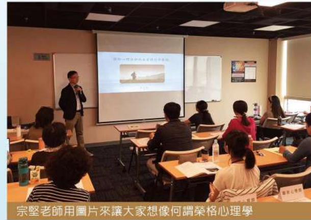
宗堅老師用圖片來讓大家想像何謂榮格心理學