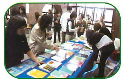
圖二 美國書商 Routledge 與心靈坊擺設書展

在這場豐盛的知識饗宴之外，會場另外邀集中文書商及提供物件廠商進行展售(如圖二、圖三)，與會人員滿載而歸，為會場增色不少!!