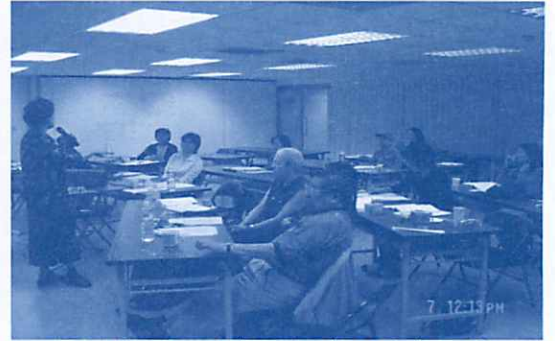
沙遊技術研習會—個案研討會—景